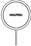
MANYETİK KABLOSUZ ŞARJ CİHAZI